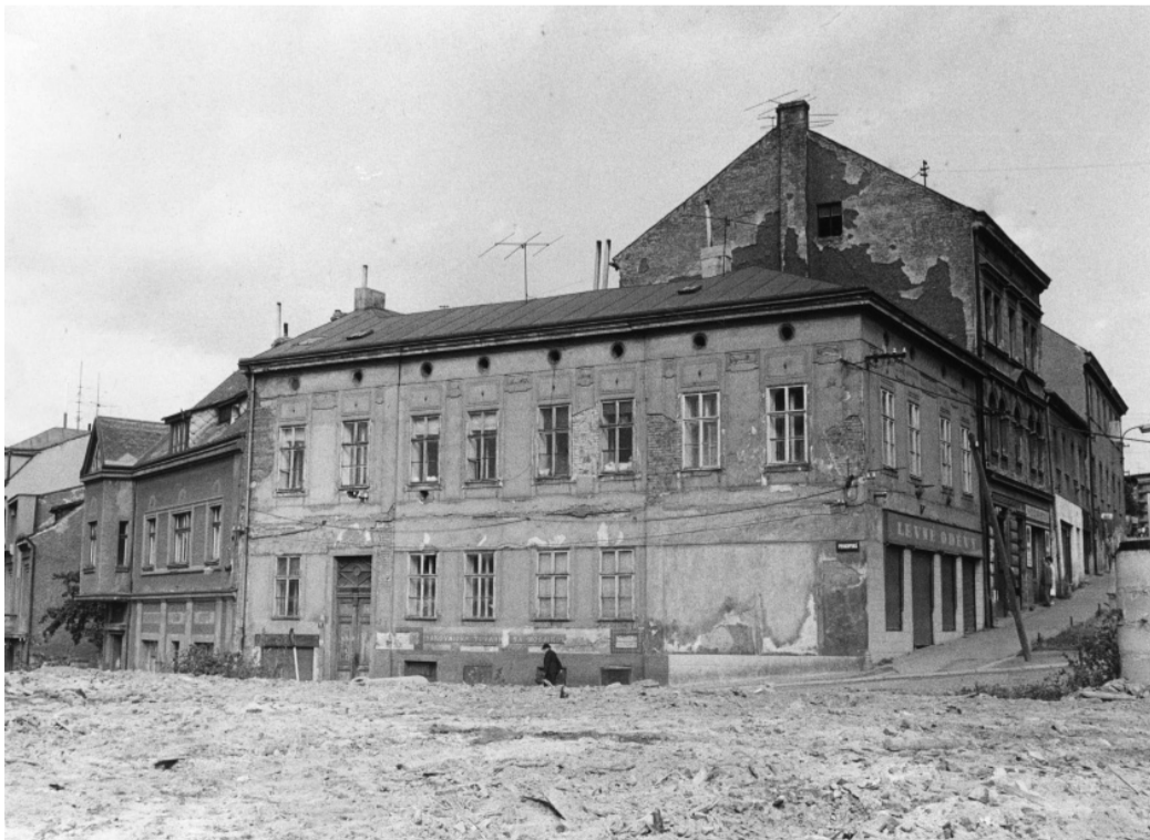
Dům stojící na místě někdejšího špitálu počátkem 70. let 20. století.